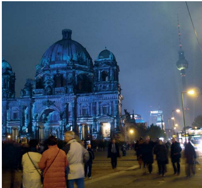
Berlin um 2008 mit Fernsehturm