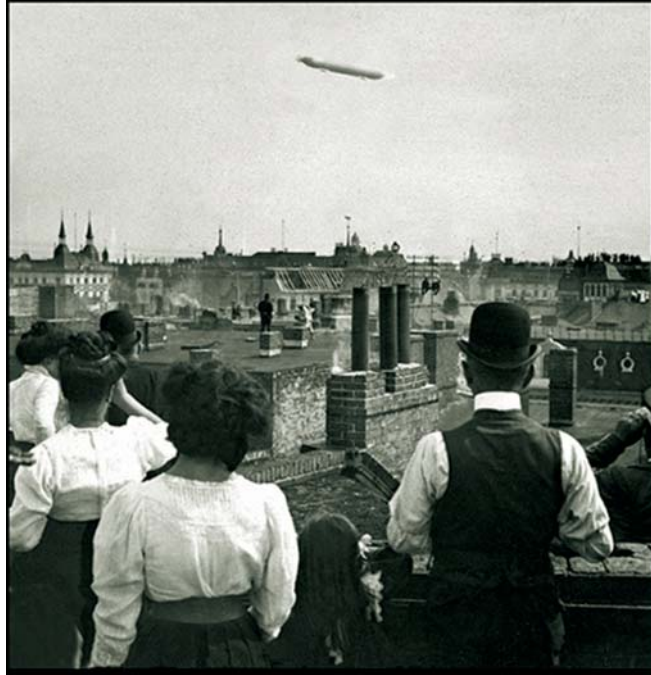
Berlin um 1909 – mit Zeppelin!