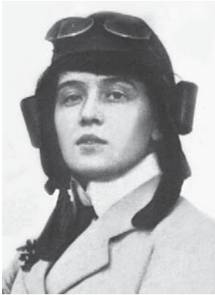
Amelie Hedwig Beese (1886-1925)

Die realen Ereignisse, die die Grundlage für die Handlung bilden, haben sich nicht exakt an den Tagen und in den Wochen ereignet, in denen der Krimi spielt. Im Wesentlichen sind es die Jahre 1909 bis 1912, vereinzelt bis 1914, die ich hier zu einer zeitlichen Dichte »verwoben« habe. Den ersten Flug über Berlin und den Empfang durch Kaiser Wilhelm II. erlebte der Zeppelin tatsächlich am 29. August 1909. Das Kaiser-Wilhelm-Institut wurde im Jahr 1911 gegründet.